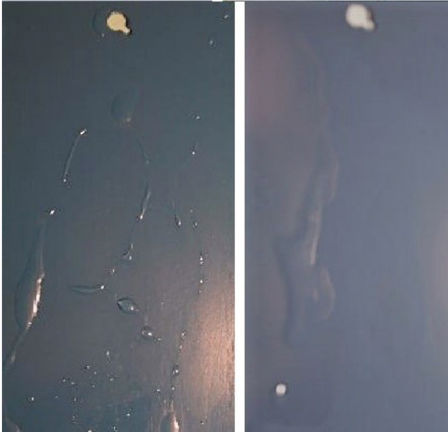
Фото. 3. На замасленій поверхні вода не розтікається, вона найчастіше утворює поодинокі краплі.