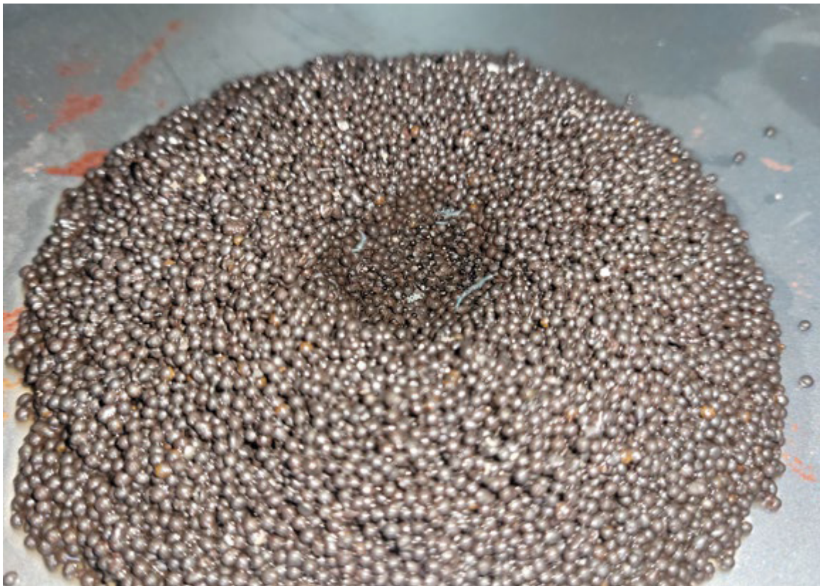
Фото. 5. Вода з заглиблення в замасленому дробі витікає не надто швидко (темніша пляма посередині).

Фото. 4. Тест з використання промокального паперу і розчинника.