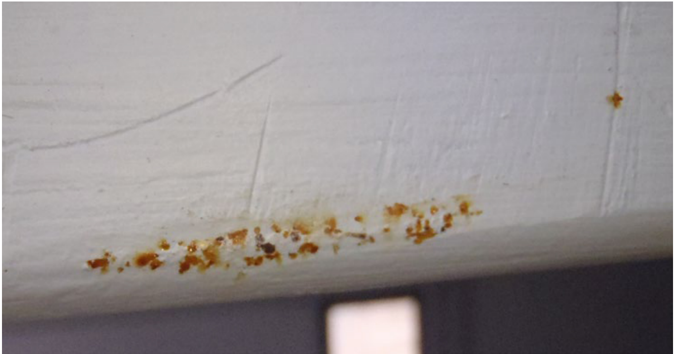
Фото. 1. Виділення амінів має різний зовнішній вигляд: від матового біло-жовтого до жовто-бурого нальоту. Зовнішній вигляд залежить від інтенсивності дефекту і використовуваного затверджувача.

Досить давно, наприкінці 90-х чи на самому початку нового тисячоліття, я здійснював нагляд над фарбуванням великих конструкцій, призначених для будівництва великого торгового центру. Конструкцій було так багато, що їх робили кілька заводів. Елементи, призначені для встановлення всередині торгового центру, а їх була більшість, були пофарбовані епоксидною ґрунт-емаллю в білий колір RAL 9010 (Pure white). Ситуація, про яку йдеться, сталася на великому виробничому підприємстві. На початку фарбування завод вимагав присутності технічного працівника постачальника фарби, яким був я. Очищення, усунення дефектів поверхні та підготовчі роботи зайняли досить багато часу, а фарбування можна було розпочати лише ввечері. Була п'ятниця наприкінці ясного літа, цех був у хорошому стані, світильники також давали добре світло. Компоненти фарби змішували разом з відповідною кількістю розчинника, а потім починали фарбування. Все пройшло ідеально, тож менш ніж через годину я запитав у начальника зміни, чи я ще потрібен.