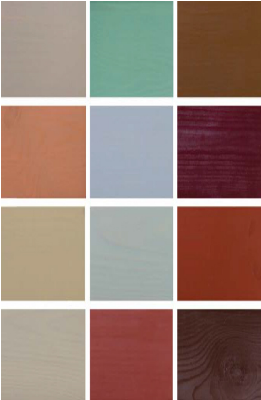
Рис.2. Відтінки Dekorwachs Lasur.

Однак, часом якість деревини не дозволяє використовувати напівпрозоре покриття. Воно стає неможливим при грибкових ураженнях, при різних відтінках деревини тощо. У цих випадках ми рекомендуємо використовувати декоративну воскову емаль «Dekorwachs Lasur Borna Wachs», яка створює непрозоре («глухе») покриття з високим сухим залишком. Dekorwachs Lasur призначена для опорядження не тільки дерев'яних будинків і альтанок, але і різних дерев'яних конструкцій, наприклад, дерев'яних віконниць чи огорожень. У ТОВ «КЕМІКАЛ-ЗАХІД» існує 13 відтінків емалей, що дозволяють створити сучасний вигляд Вашому будинку (рис. 2).