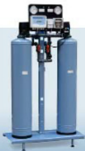
DMS. Полуавтоматический деминерализатор методом ионного обмена с прямой регенерацией. Производительность до 5 м 3 /час Качество воды: 5-20 мкСм/см