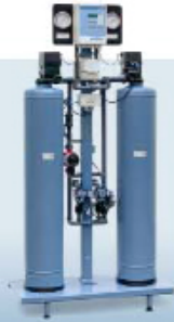
DME. Автоматический деминерализатор методом ионного обмена с прямой регенерацией. Производительность до 5 м 3 /час Качество воды: 5-20 мкСм/см