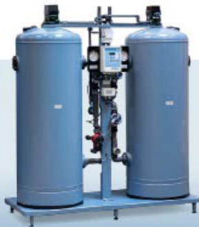
DMHE. Автоматический деминерализатор методом ионного обмена с прямой регенерацией. Производительность до 20 м 3 /час Качество воды: 5-20 мкСм/см