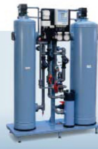
DMCE. Автоматический деминерализатор методом ионного обмена с противоточной регенерацией. Производительность до 13 м 3 /час Качество воды: 0,1-5 мкСм/см